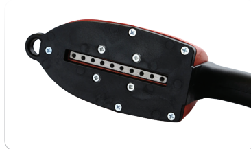
Brosse de surchauffe vertical + chiffon microfibre