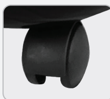
Roues en plastique anti-rayures. 360°