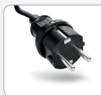
Prise électrique SCHUKO avec 5m câble électrique 1~ 230 V - 50/60 Hz