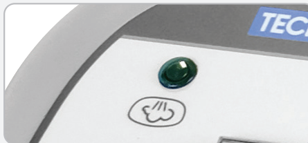
Indicateur lumineux - VAPEUR PRET