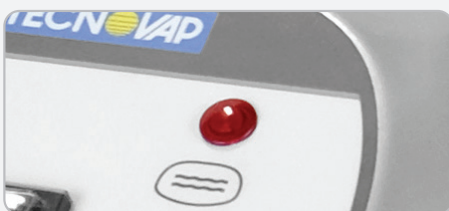
Indicateur lumineux - MANQUE D'EAU