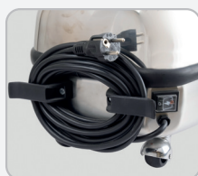
Support rangement câble électrique