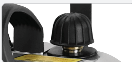
Bouchon de chaudière