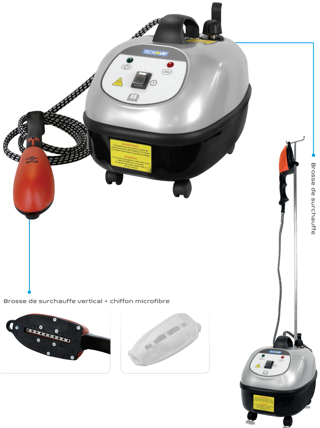
Brosse de surchauffe